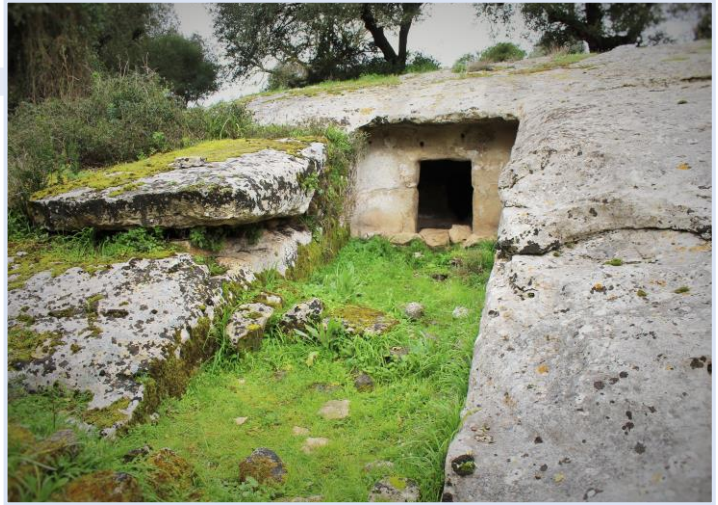
Domus de Janas Badde Nare

Il ritrovo del gruppo avverrà presso l'info point VIVA di Padria (via Nazionale, 11), alle ore 08:30, per poi recarsi al punto di partenza dopo un breve tragitto in macchina di tre chilometri. Il trekking sarà frazionato in due tappe intervallate da un secondo spostamento, in auto di 7 km, da Padria a Mara in Loc. Bonu Ighinu, per la pausa pranzo e riprendere con la seconda parte